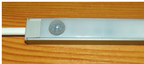
Obr.2 - Ukázka instalace do profilu